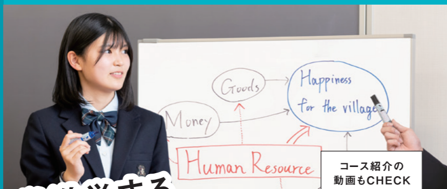
コース紹介の 動画もCHECK

英語文献の読み方の習得やパブリック・スピーキング、ディベート、エッセイ・ライティングに磨きをかけます。